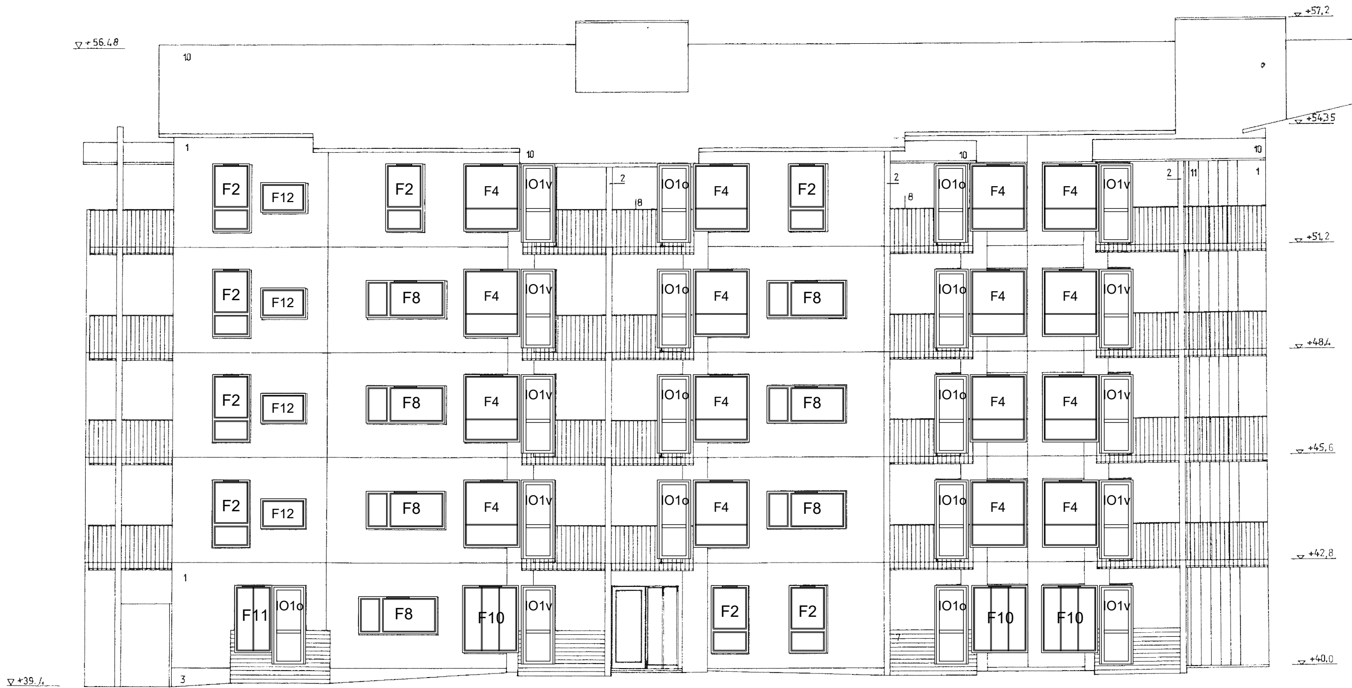
sisäpihan julkisivu, A–porras